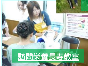
訪問栄養長寿教室