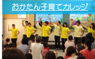
おかたん子育てカレッジ