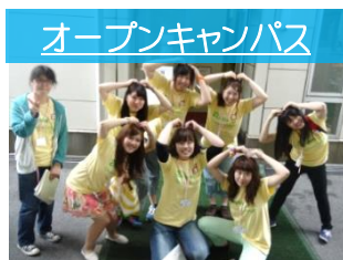
オープンキャンパス